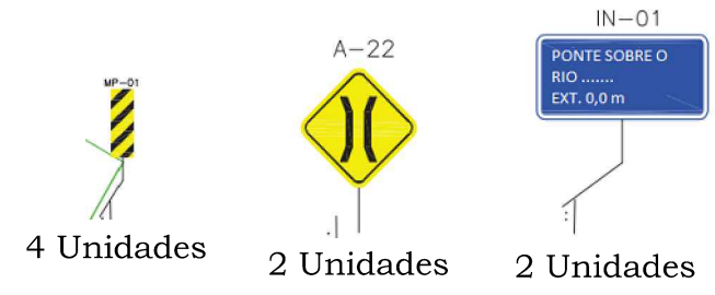
PLACAS DE SINALIZAÇÃO SEM ESCALA