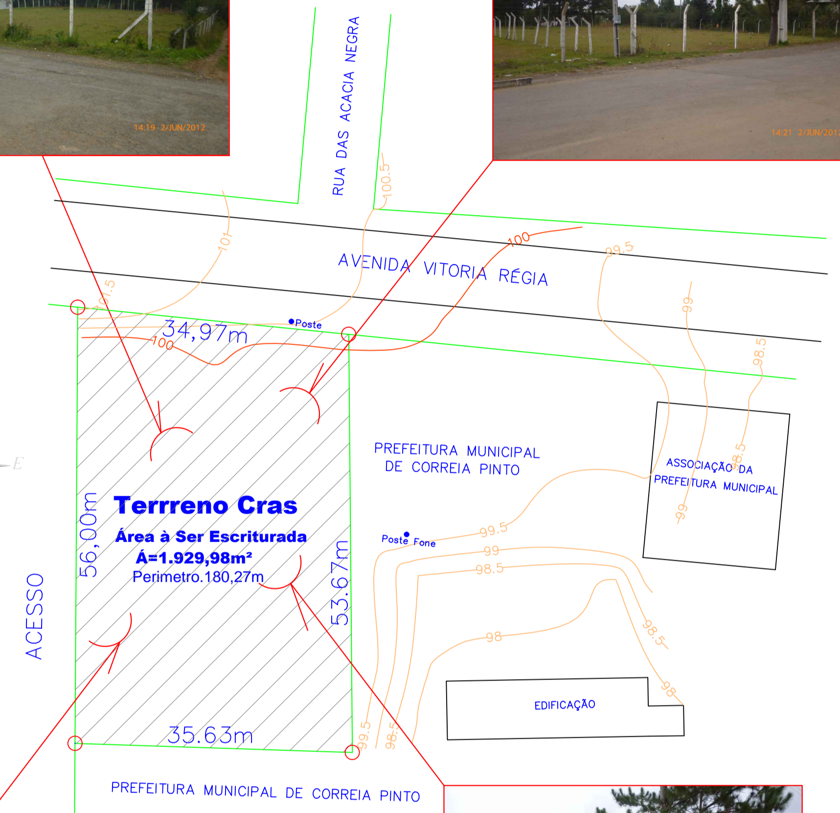
SITUAÇÃO ESCALA 1/300