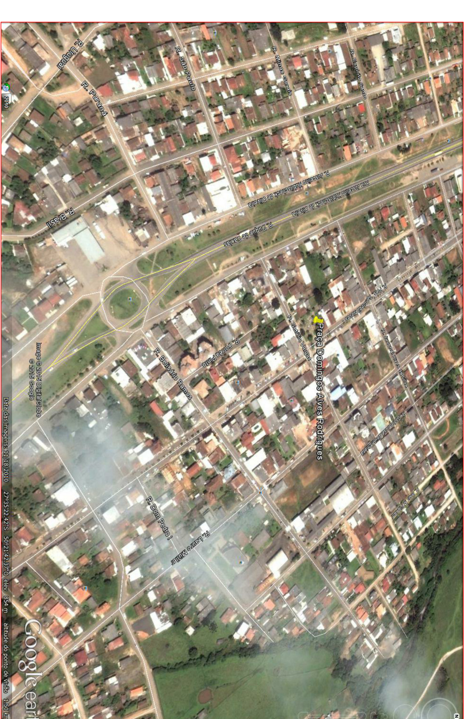
IMAGEM DE LOCALIZAÇÃO Imagem de localização da Praça Domínios Alves Rodrigues, localizada no município de Amures, Paraná, com o ponto de referência da área de levantamento da Praça Domínios Alves Rodrigues. Latitude: 27°05' 18,86" S Longitude: 50°42' 42,77" O